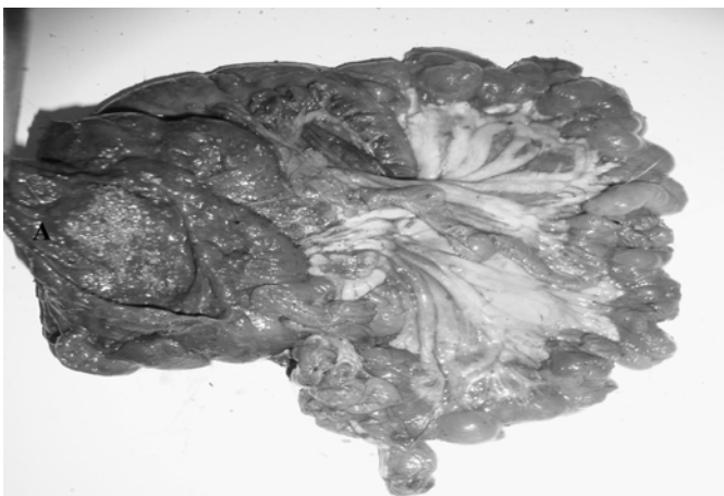
Fig. 2. Sablose no intestino grosso de cutia ( Dasyprocta aguti ) criada em cativeiro. Visualização da areia em meio à ingesta no ceco (A).

A distocia foi observada em dois animais (6,24%). Um animal apresentava histórico de gestação, com contrações peristálticas uterinas insuficientes na tentativa de expulsão do produto há mais de 24 horas, porém sem nascimento de