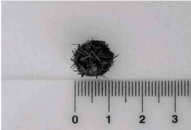
Fig.4. Aspecto macroscópico do enterólito causador da obstrução total da porção distal do jejunum em cutia ( Dasyprocta aguti ) criada em cativeiro.

Em um animal, foi observado fecaloma (3,20%), caracterizado pela presença de massa fecal ressecada, de consistência pétrea, que promovia a obstrução total do reto e ulceração da mucosa (Fig.5). Outra lesão obstrutiva no trato digestório foi observada no esôfago por um fragmento grande de melancia que promoveu o impedimento da deglutição dos alimentos, anorexia e necrose da mucosa na porção cervical do esôfago (3,20%).