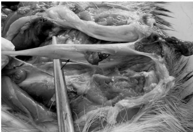
Fig.5. Aspecto macroscópico do fecaloma encontrado no lúmen do reto em cutia ( Dasyprocta aguti ) criada em cativeiro.

Dezesseis cutias necropsiadas ficaram sem diagnósticos, sete por não apresentarem lesões macroscópicas e microscópicas compatíveis com nenhuma enfermidade e nove por apresentarem avançado grau de autólise (50%).