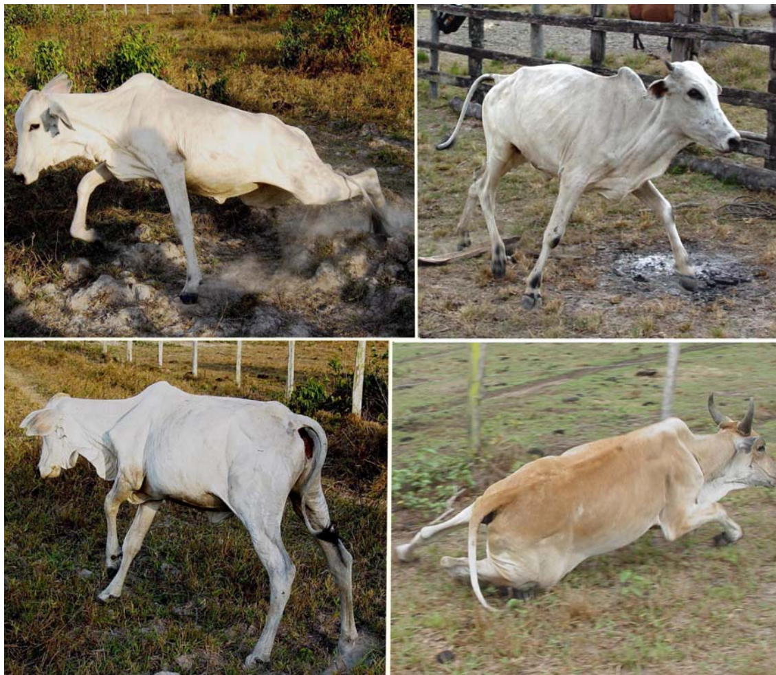
Fig.3. Bovinos intoxicados por Ipomoea asarifolia , que apresentavam tremores de intenção e ao serem movimentados apresentaram hipermetria, ataxia e quedas.

nhum proprietário relatou a ocorrência da intoxicação nessa espécie. A doença também não foi observada em caprinos, nas três propriedades que criavam esta espécie.