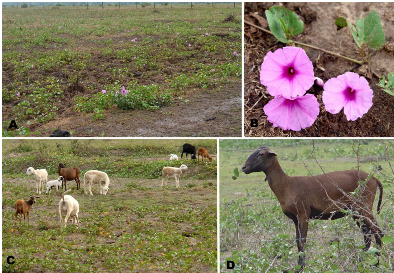
Fig.1. (A) Pasto severamente invadido pela "salsa", Ipomoea asarifolia , no município de Cachoeira do Arari. (B) Flores e folhas de I. asarifolia . (C) Ovinos pastejando em uma área severamente invadida por I. asarifolia . (D) Ovino ingerindo folhas de I. asarifolia .

Foram visitadas 7 propriedades rurais na Ilha de Marajó, 6 localizadas no município de Cachoeira do Arari e uma no município de Soure, com histórico da ocorrência de doença tremorgênica. Em todas as propriedades eram criados búfalos, em duas havia também bovinos, em 5 havia ovinos e em 3 caprinos. Durante as visitas foi realizado levantamento das plantas tóxicas existentes, estudo epidemiológico das intoxicações, avaliação clínica de animais intoxicados, necropsias de animais gravemente doentes e coleta de material para estudo histopatológico. Foram eutanasiados e necropsiados um ovino e um bovino. Durante a necropsia dos animais foram coletados fragmentos de todos os órgãos da cavidade abdominal e torácica e encéfalo. O encéfalo, após a fixação, foi cortado transversalmente, coletando-se fragmentos nas regiões do córtex parietal, temporal, occipital e frontal, núcleos da base, tálamo, mesencéfalo a altura do colículo