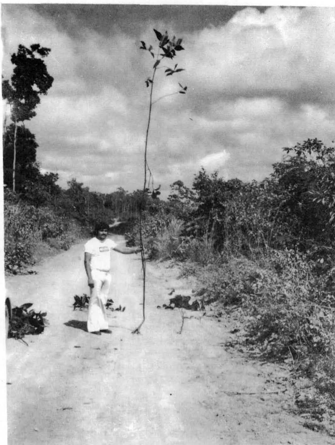
Fig. 1. Arbusto de Palicourea juruana retirado da mata, município de Paragominas, Pará.

6 Os experimentos com a planta dessecada podem dar falsos resultados negativos; se os primeiros experimentos com uma planta suspeita de toxicidade forem feitos com a planta dessecada e resultarem negativos, mesmo assim a planta verde pode ser tóxica, tendo perdido a sua toxidez durante a dessecagem. Já um resultado positivo com material vegetal dessecado permite concluir que a planta realmente é tóxica.