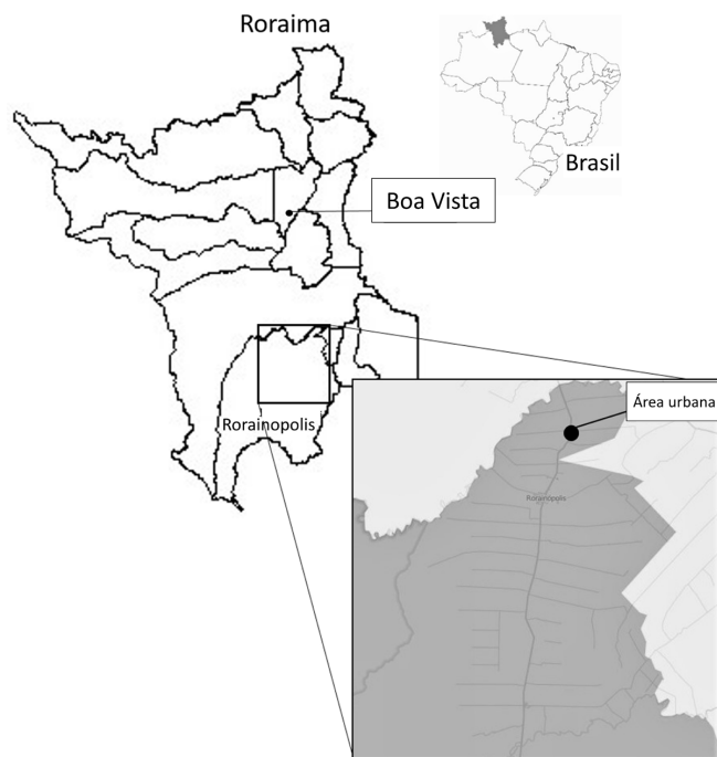
Fig.1. Mapa do município de Rorainópolis, Estado de Roraima, com destaque para a região nordeste ao longo da Rodovia BR-147 e vicinais onde foram realizadas as coletas de equinos.

O município de Rorainópolis (00°56'45" Norte e 60°25'04" Oeste) situa-se na região sul de Roraima, distante 290 quilômetros da capital Boa Vista (Fig.1). No município predomina o clima quente, com chuvas no verão e outono, temperatura média anual de 26°C e precipitação pluviométrica de 1.750mm. Na região nordeste do município o clima é equatorial com estação seca (Roraima 2014). Dados censitários de 2012 demonstram que a população de equinos no município foi estimada em 1426 animais (IBGE 2012). O número de equinos analisado foi calculado pelo programa EpiInfo 7.0 (CDC-Atlanta), considerando estimativa de prevalência de 50%, erro de 5% e confiança de 95%. Para compor o estudo, foram sorteadas propriedades presentes ao longo da BR-174 e estradas vicinais.