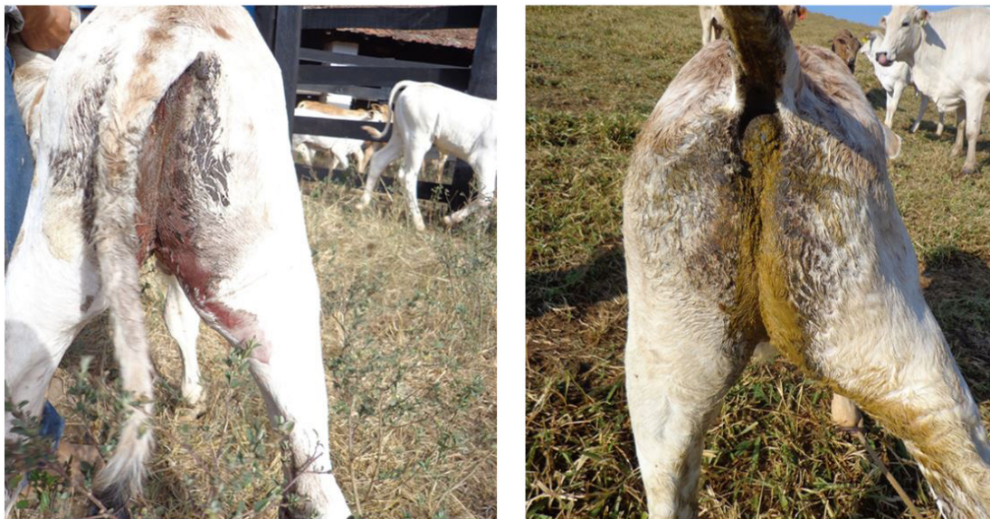
Fig.3. (A) Bezerro com diarreia sanguinolenta antes do tratamento com toltrazuril 15mg/kg. (B) Mesmo bezerro com diarreia (sem a presença de sangue) 3 dias após o tratamento com toltrazuril 15mg/kg.