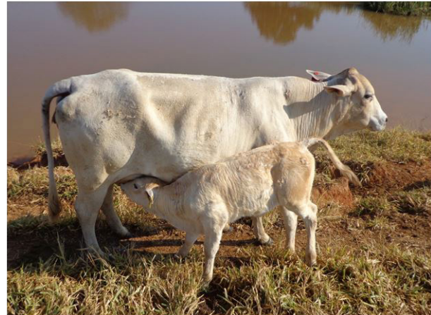
Fig.4. (A) Imagem demonstrando a possível ingestão de oocistos esporulados por meio de água contaminada, no pasto onde os surtos ocorreram. (B) Bezerro amamentando demonstrando possivelmente a ingestão de oocistos esporulados que por ventura se aderiram nas tetas das vacas.

da infecção, em criações extensivas, as áreas onde acumulam a água das chuvas (cacimbas), utilizadas como bebedouros pelos animais, também podem servir como fonte de infecção para oocistos de Eimeria spp. No presente estudo, é importante destacar que a água para os animais beberem era proveniente de nascentes que eram represadas para haver a formação de lagoas no pasto. Em função da idade dos bezerros deste estudo se alimentarem de leite materno (Vaz et al. 2011) e água, muito provavelmente a infecção destes animais por Eimeria spp. aconteceu por meio da ingestão de água diretamente, ou, indiretamente, quando, por ventura, oocistos esporulados se aderiram nas tetas das vacas, quando estas adentraram estas lagoas para beberem água, e quando os bezerros foram amamentar acabaram ingerindo a forma infectante deste protozoário (Fig.4AB).