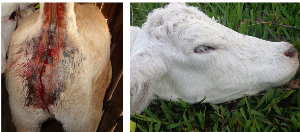
Fig.1. (A) Bezerro apresentando diarreia sanguinolenta desencadeada pelo elevado parasitismo por Eimeria spp. (OoPG 61.550; 99% de parasitismo por Eimeria zuernii ). (B) Bezerro desidratado, diagnosticado por meio da profundidade do globo ocular.

a Médias seguidas pela mesma letra maiúscula na linha, não diferem entre si ( P > 0,05 ), b Probabilidade de significância do Teste.