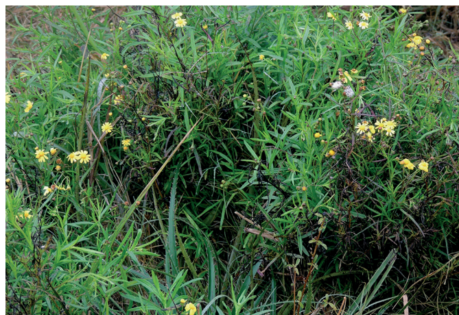
Fig.1. Senecio madagascariensis com flores e sementes.

Biopsias hepáticas nos ovinos experimentais foram realizadas aos 30 e 90 dias após o início de cada experimento. A técnica utilizada foi a percutânea com agulha Menghini modificada descrita por Néspoli et al. (2010). Os ovinos eram mantidos em decúbito lateral esquerdo realizando-se a tricotomia e antisepsia no local da biopsia. Posteriormente a área era infiltrada com 5ml de solução cloridrato de lidocaína a 2% nos pontos de introdução da agulha que era inserida em sentido crânio-ventral, no