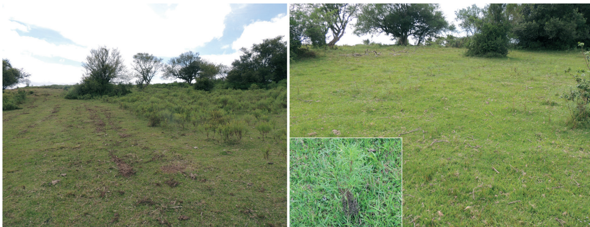
Fig.7. Área do Experimento 4. (A) Observa-se a área roçada (10.2013) ao lado da área com Senecio brasiliensis . (B). Na área roçada há Senecio em brotação (02.2014).

infestação por S. madagascariensis era alta na área foi realizada dessecação com duas aplicações do herbicida glifosato (Roundup®) em intervalos de quinze dias. Posteriormente foi feita a aração, a gradagem e o plantio de Panicum spp. e Arachis pintoii (amendoim forrageiro). Em março de 2014 havia crescimento vigoroso da pastagem que apresentava, também, S. madagascariensis em brotação e floração. Em julho de 2014 a área foi roçada. A técnica foi repetida por três vezes uma vez que a planta rebrotava em grande quantidade, após aproximadamente 30 dias da brotação das culturas semeadas (Fig. 6 A e B). A área foi dessecada novamente para o plantio de soja em julho de 2015.