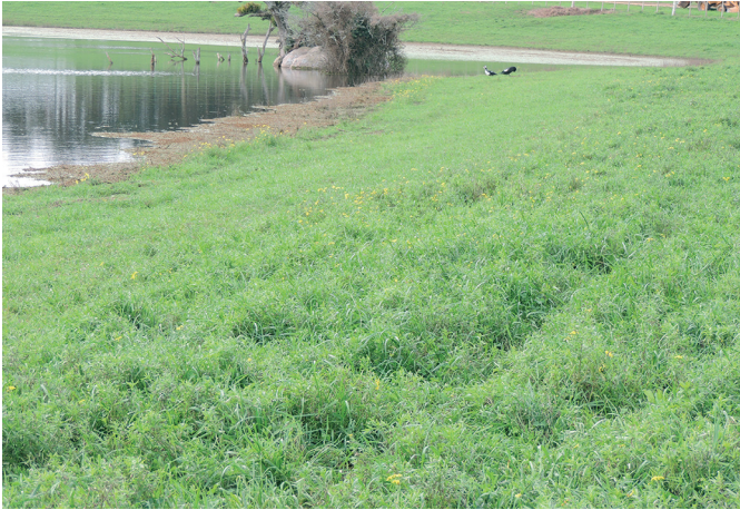
Fig.3. Senecio madagascariensis florescendo na área de infestação alta utilizada no Experimento 1, um ano após o primeiro ingresso dos ovinos.

áreas consideradas de alta e média infestação com valores de p=0,004 e p=0,007 , respectivamente (Quadro 2).