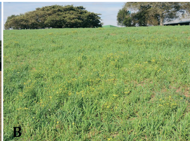
Fig.5. Área do Experimento 2 utilizando pastejo rotativo com ovinos. (A) Área dessecada com Glifosato (Roundup®) após a retirada dos ovinos (04.2015). (B) Senecio madagascariensis misturado a pastagem, 120 dias após a dessecação (08.2015).