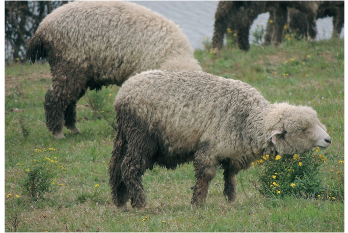
Fig.4. Ovinos consumindo Senecio madagascariensis no Experimento 2.

Experimento 2. Controle de Senecio madagascariensis pelo pastejo rotativo utilizando 10 ovinos/0,5ha