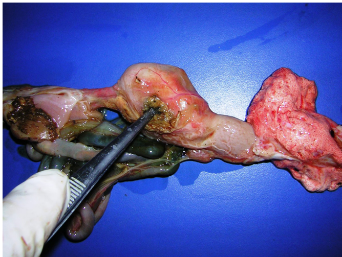
Fig.4. Perfuração em ventrículo de curicaca ( Theristicus caudatus ) por corpo estranho.

tódeos, sendo que destes 70% (7/10) possuíam o parasita no intestino delgado, 10% (1/10) no proventrículo; 10% (1/10) no intestino grosso e em 10% (1/10) no proventrículo, na moela e no intestino delgado. Platelminhos foram observados no intestino delgado de 4,3% (2/46) das aves e 8,7% (4/46) apresentavam múltiplos pontos brancos em pleura e em musculatura identificados como ácaros. Dos parasitos encontrados não foram localizados as suas classificações, para melhor detalhamento.