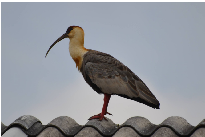
Fig.2. Exemplar de curicaca ( Theristicus caudatus ) na região de Lages, Santa Catarina.

Em relação as afecções clínicas destes animais, 55,8% (43/77) possuíam fratura óssea, sendo 37,2% (16/43) no tibiotarso, 23,2% (10/43) no úmero, 23,2% (10/43) no rádio e ulna, 11,7% (5/43) no fêmur, 11,7% (5/43) no metacarpo (Fig.2), 2,3% (1/43) no crânio e 2,3% (1/43) no bico. Destes animais apenas 23,3% (10/43) foram submetidos ao tratamento cirúrgico, sendo sete cirurgias de osteossíntese, duas amputações de metacarpo e uma reconstrução de bico.