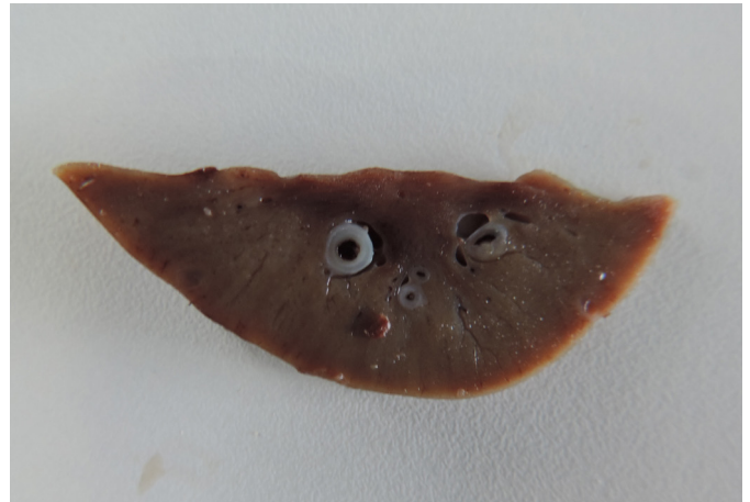
Fig.1. Superfície de corte de fragmento de rim fixado evidenciando espessamento acentuado de vasos localizados nas regiões cortical e córtico-medular (Capivara C1).

Microscopicamente, nos dois animais, as artérias renais afetadas, principalmente as interlobares e interlobulares,