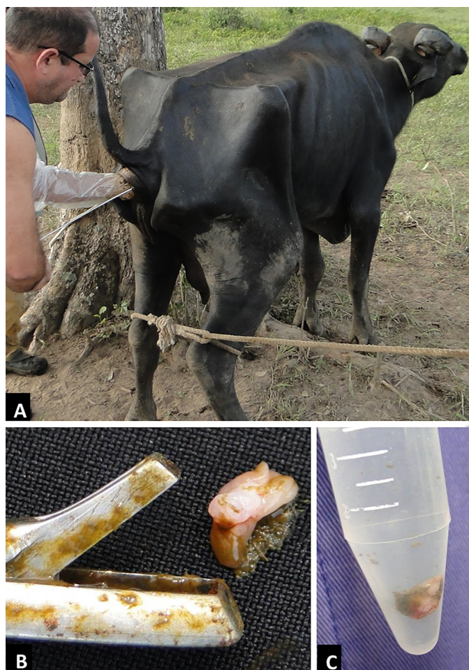
Fig.1. (A) Realização de biópsia retal, com auxílio de uma pinça Mathieu, para o diagnóstico de paratuberculose em búfalo. (B) Fragmento coletado. (C) Fragmento coletado em frasco tipo Falcon, em formol a 10%.

Kit comercial da Qiagen (QIAamp® DNA Mini Kit para tecidos). A reação de qPCR foi realizada usando os Primers e sondas para o gene is900 (F-5'-TGCTGATCGCCTTGCTCA-3' e R-5'-GGGCTGATCGGCGATGAT-3'; S-5'-FAM-CCG GGC AGC GGC TGC TTT ATA TTC-3'-BHQ1) (Sigma®); e os Primers e sondas para f57 (F-5'-TTCATC-GATACCCAACTCAGAGA-30 e R-5'-GTTCGCCGCTTGAATGGT-3'; S-5'-Cy5-5'-TGCCAGCCGCCACTCGTG-3'-BHQ2) (Sigma®) (Ireng et al. 2009). Na reação foram utilizados 2µl de solução de DNA, 12,5µl do Mix (RealQ-PCR-RT dUTP-UNG Master Mix kit) (Ampliqon, Dinamarca), Primers na concentração de 0,6 pmol/µl e sondas na concentração de 0,4 pmol/µl, 0,5µl de H 2 O e 2µl de MgCl 2 (50nM) (Invitrogen®), num volume total de reação de 25µl. A reação foi iniciada a 50°C durante 2 minutos, e 95°C, durante 10 minutos, seguido por 45 ciclos de desnaturação a 95°C, durante 15 segundos, anelamento/extensão a 60°C durante 1 minuto. Cada amostra foi testada em triplicata no termociclador LightCycler 480 (Roche, Alemanha) de análise de dados.