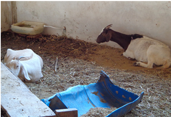
Fig.4. Cabra 123 (esquerda) e Cabra 93 (direita) 72 horas após a administração do triclorfon.