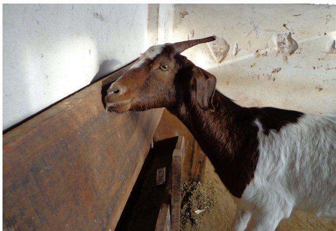
Fig.1. Cabra 93 com sialorreia e dificuldade de se manter em estação.

Por outro lado, cerca de 40 minutos após a administração do triclorfon nas cabras, oito das 20 apresentaram sinais clínicos sugestivos de intoxicação pelo princípio ativo supracitado. Estes oito animais começaram a apresentar ataxia, alguns ficaram em decúbito externo-lateral, apresentaram sialorreia (Fig.1), tremores, constrição das pupilas, dispneia com ruídos, micção e defecação involuntária (Fig.2), paresia espástica, timpanismo e lacrimejamento (Quadro 1). Logo após a detecção de tais sinais clínicos (cerca de 45 minutos após a administração do triclorfon e conseqüentemente cinco minutos após o início dos sinais de intoxicação), foi administrado, nos oito animais, via endovenosa sulfato de atropina 1% na dose de 0,5mg/kg mais fluidoterapia como tratamento suporte. Cerca de 20 minutos após a administração do sulfato de atropina, os oito animais ficaram em estação novamente, entretanto, cinco ainda apresentavam tremores musculares e por este motivo receberam mais uma dose de sulfato de atropina