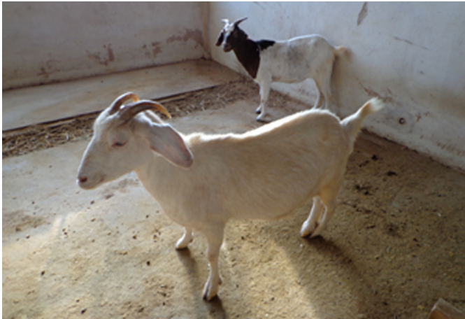
Fig.3. Cabra 123 (à frente) e Cabra 93 (atrás) cerca de dez minutos após a primeira administração de sulfato de atropina 1% (0,5mg/kg).

Na necropsia das cabras, como achados macroscópicos foi possível observar mucosas cianóticas, congestão de fígado, baço e rins, vasos mesentéricos congestos, vesícula biliar repleta, enfisema pulmonar, parênquima pulmonar avermelhado (Quadro 2).